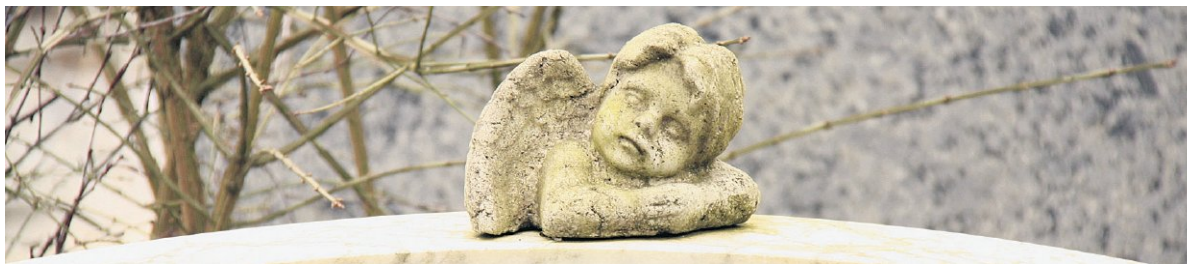
Uit NRC Handelsblad, zaterdag 22 oktober 2011.

die aan de vooravond van een zware operatie door diepe vrees voor het hellevuur zijn bevangen. Als regel wordt dit kruis in stilte gedragen, of hooguit in de kring van familie en geloofsgenoten.